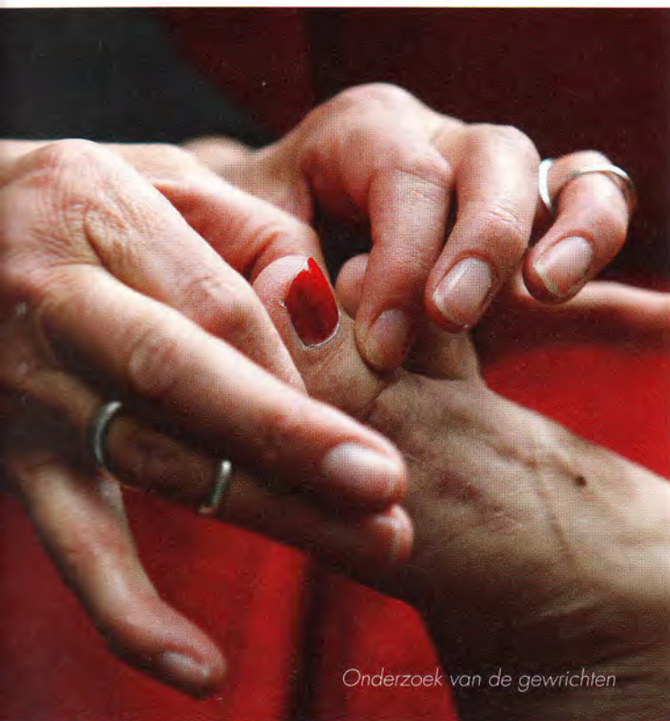
Onderzoek van de gewrichten

Omdat mensen met reumatoïde artritis niet onbeperkt als patiëntdocent kunnen worden ingezet en steeds meer organisaties de weg naar de stichting weten te vinden, is besloten om de vrijwilligerspool uit te breiden. "We hebben via verschillende kanalen een oproep geplaatst. Van de 25 belangstellenden hebben uiteindelijk tien personen de opleiding gevolgd. Eind november was de afsluiting met een driedaagse praktijktraining in Elspeek. De helft van de cursisten kan direct worden ingezet. Dat is een mooi resultaat, want de opleiding is best pittig. Dat geldt vooral voor het anatomiegedeelte waarvoor de cursisten ook de Latijnse namen van lichaamsdelen