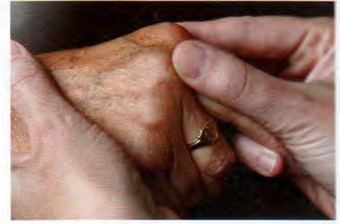
Medisch studenten worden geholpen met gewrichtsonderzoek