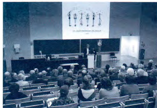
Het zwaartepunt verschoof naar competenties rond samenwerken en beleidsvoering.