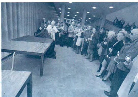
Een symbolisch kunstwerk van Dirk Boulanger